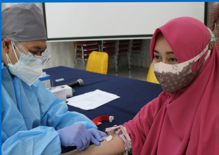
Pelaksanaan Rapid Test bagi Peserta Latsar

Sebelum pelaksanaan Rapid Test , peserta diberikan arahan-arahan terkait protokol kesehatan yang harus diterapkan saat kegiatan Latsar nantinya. Tim satgas COVID-19 UM secara langsung mengingatkan akan pentingnya protokol kesehatan ini. “Selama kegiatan di Jakarta nanti, bapak ibu disarankan membawa dan menggunakan barang-barang sendiri ya, seperti kotak makan, sendok, dan lain sebagainya. Jangan lupa untuk membawa obat-obatan