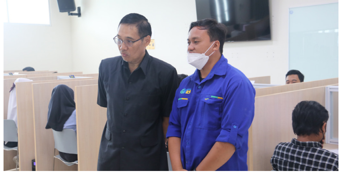
Visitasi Rektor UM di lokasi UTBK gedung GKB.

didukung pengawasan CCTV, dan pemeriksaan menggunakan metal detector oleh tim pengawas ujian," ungkap Rektor UM.