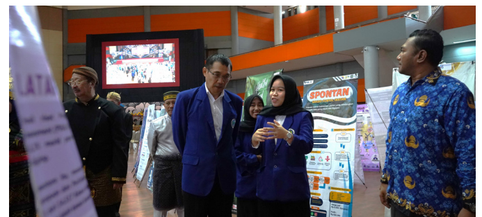
Perwakilan peserta menjelaskan karyanya kepada Rektor UM.