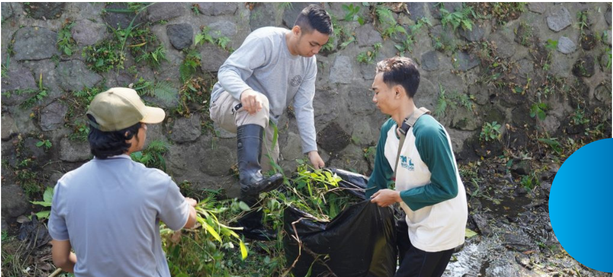
Kegiatan gerakan bersih sungai oleh HMD (Himpunan Mahasiswa Departemen) Biologi UM.

Bapak Sapto berharap, gerakan bersih sungai yang diprakarsai HMD Biologi UM ini dapat menjadi penggerak bagi mahasiswa dari fakultas lainnya untuk melakukan hal serupa. Beliau berkomitmen untuk menerima segala ajakan gerakan bersih lingkungan dari mahasiswa dengan tangan terbuka. “Kalau bukan mahasiswa yang menjadi penggerak, siapa lagi? Ayo kita bersama-sama jaga kebersihan lingkungan, kita jaga Kota Malang,” pungkas beliau.