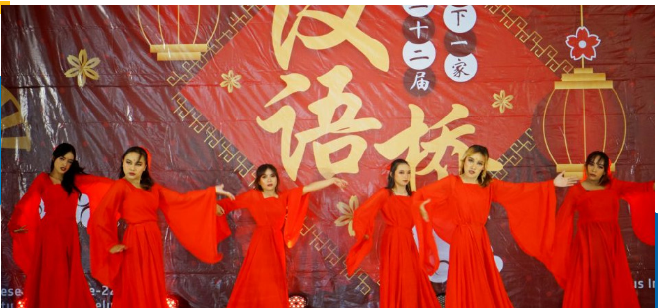
Peserta seleksi lomba Chinese Bridge menampilkan performa tarian.

Rektor UM Prof. Dr. Hariyono selaku tuan rumah pada acara ini juga memberi sambutan perihal kesempatan untuk meningkatkan hubungan baik Indonesia dengan China serta peluang kerja sama antar perguruan tinggi melalui Chinese Bridge tahun ini. Beliau berharap kepada peserta kegiatan ini agar mempelajari lebih dalam mengenai negara China, tidak hanya bahasanya akan tetapi juga budayanya sehingga dapat menyalurkan pengetahuan yang mereka miliki dengan lebih baik. Dengan melakukan hal tersebut bisa menjadi langkah awal untuk menjembatani kerjasama yang lebih baik dengan perguruan tinggi di China.