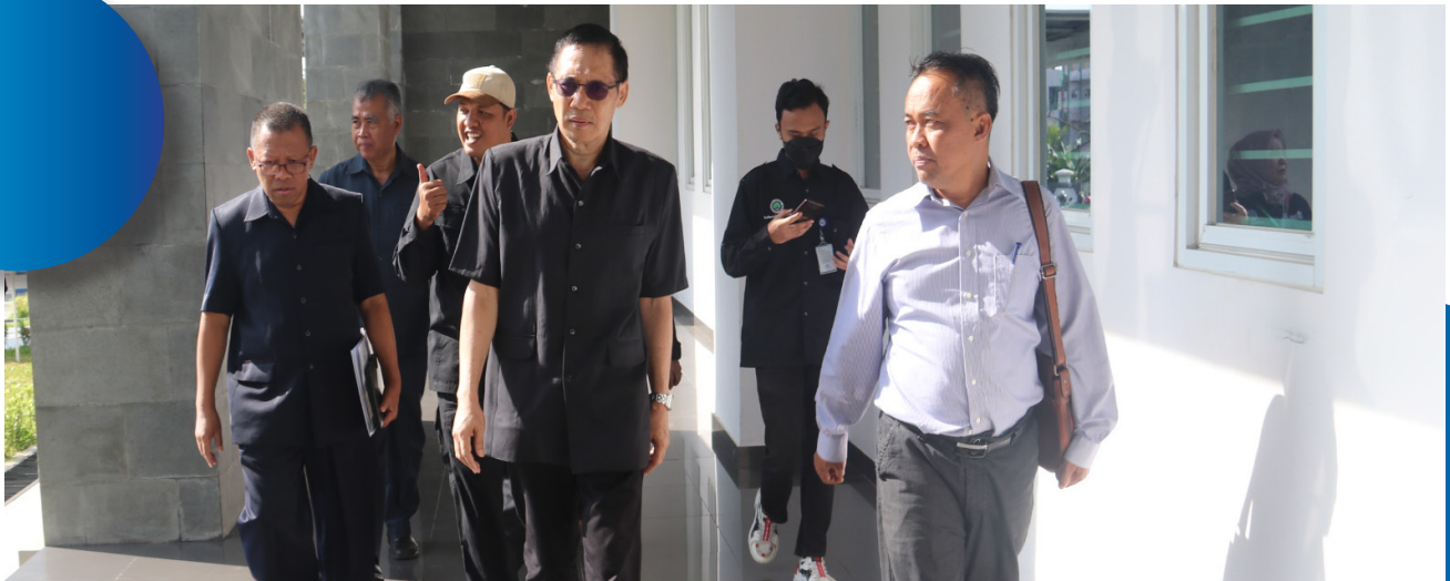
Rektor UM bersama Panitia Pelaksanaan UTBK menuju ke Lokasi Pelaksanaan UTBK.