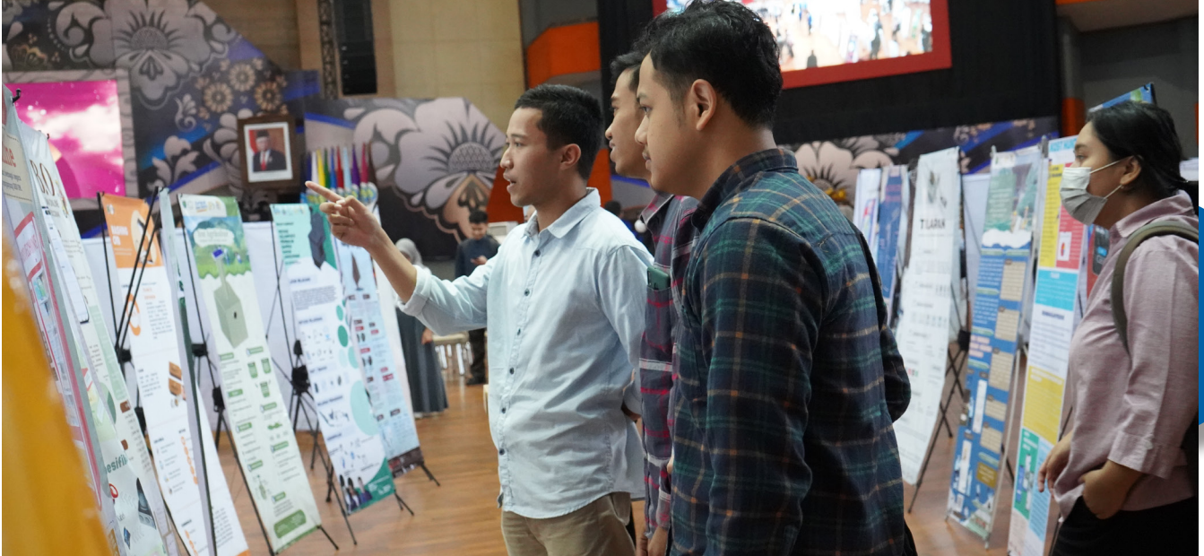
Pengunjung kegiatan INFEST #7 memperhatikan karya peserta.

Malang. Beragam poster inovasi karya mahasiswa UM (Universitas Negeri Malang) memadati Graha Cakrawala pada Selasa (02/05). Poster tersebut tertata rapi dalam rangka Pameran Akademik INFEST #7 yang mengusung tema “SINERGI: Inovasi Visioner Membangun Negeri”. INFEST #7 merupakan bagian dari kesadaran generasi muda untuk bergotong-royong mewujudkan negara yang maju dan berkembang dengan inovasi-inovasi yang bernas. Acara tersebut dihadiri oleh Rektor UM, Ketua Senat Akademik UM, para Wakil Rektor, Ketua Lembaga Pengembangan Pendidikan dan Pembelajaran (LPPP) UM, para Direktur, para Dekan dan Wakil Dekan, Dosen dan Tenaga Kependidikan, serta seluruh sivitas akademika UM.