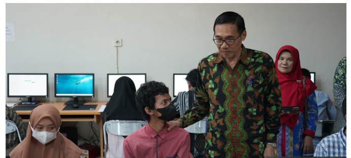
Rektor UM mengunjungi lokasi pelaksanaan UTBK untuk peserta disabilitas.

bahwa belum semua gedung telah difasilitasi akses bagi penyandang disabilitas. Tetapi berdasarkan laporan yang kami terima, peserta UTBK-SNBT baik penyandang disabilitas maupun yang normal dapat hadir pada ruang ujian dengan baik, mudah-mudahan mereka tidak mengalami kesulitan mulai dari sarana prasarana dan pelaksanaan tesnya,” lanjut Beliau.