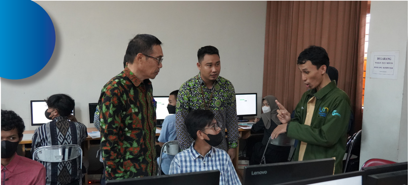
Rektor UM bersama Pendamping dan Peserta Disabilitas UTBK 2023